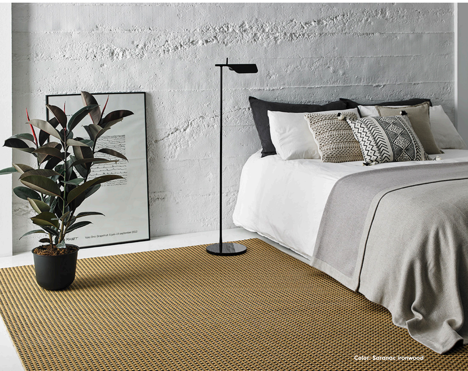
Color: Saranac ironwood

Woven rug made of wood fibers. It's warm and very contemporary thanks to its simple design.